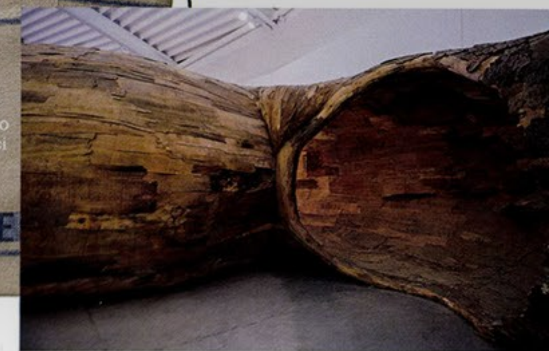
16 NEL SEGNO DEL LEGNO Rifugiarsi in un maxi tronco per catturare l'energia di rami e corteccia. È l'opera Transarquitetónica di Henrique Oliveira, in scena nel nuovo Centro Pecci di Prato, fino al 19/3.