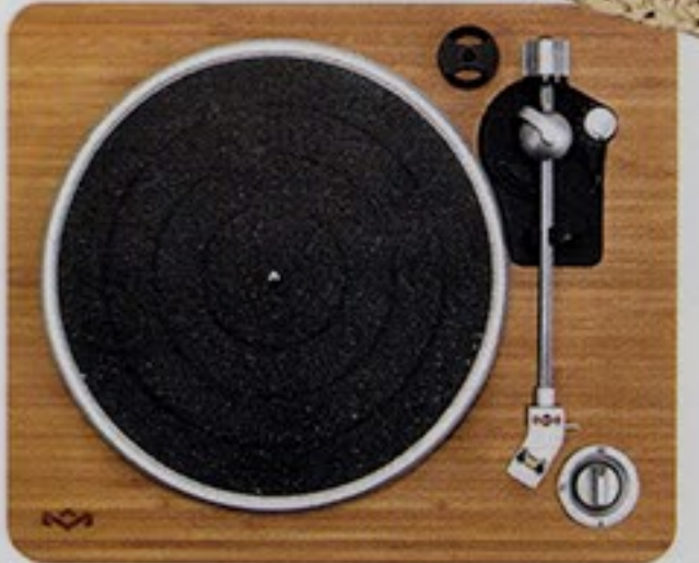
25 GOOD VIBE Con la struttura in bambù naturale, il piatto in alluminio riciclabile e l'uscita Usb per registrare da pc, il giradischi "Stir It Up" di House of Marley mixa passato e futuro.