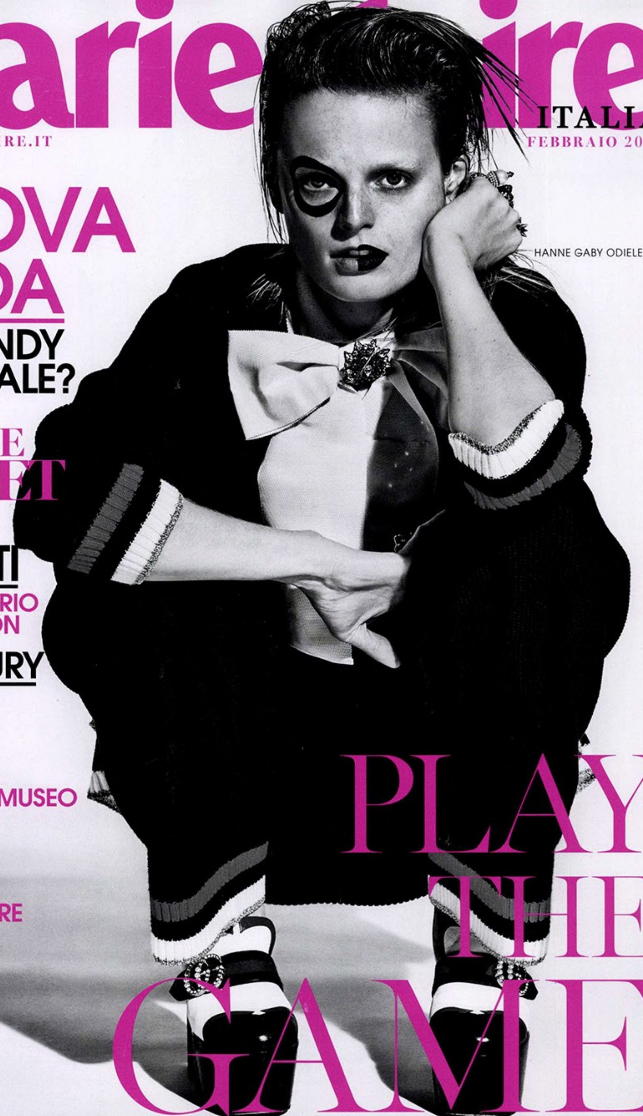
HANNE GABY ODIELE