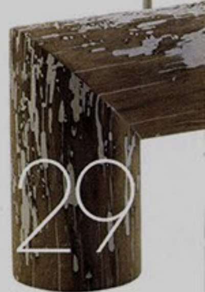
29 (S)OGGETTI DI RECUPERO È fatta con le "briccole", i pali di rovere provenienti dalla laguna di Venezia, "Anti-Comfort". È una «non sedia», tutta artigianale, nata da un progetto di Andrea Branzi per Riva 1920.