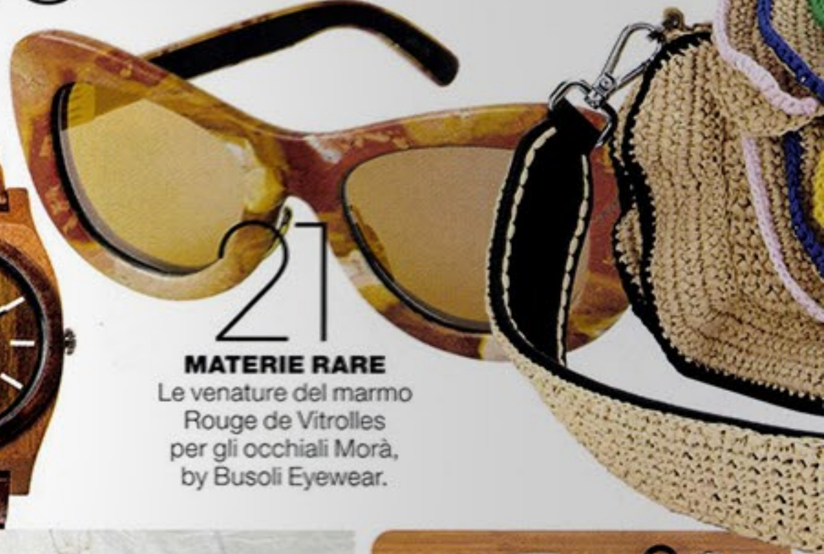
21 MATERIE RARE Le venature del marmo Rouge de Vitrolles per gli occhiali Morà, by Busoli Eyewear.