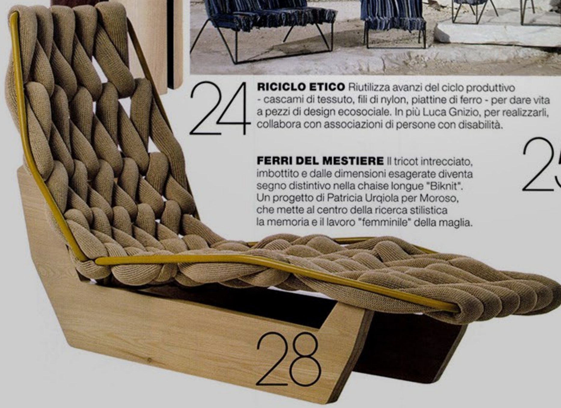
28 FERRI DEL MESTIERE Il tricot intrecciato, imbottito e dalle dimensioni esagerate diventa segno distintivo nella chaise longue "Biknit". Un progetto di Patricia Urquiola per Moroso, che mette al centro della ricerca stilistica la memoria e il lavoro "femminile" della maglia.