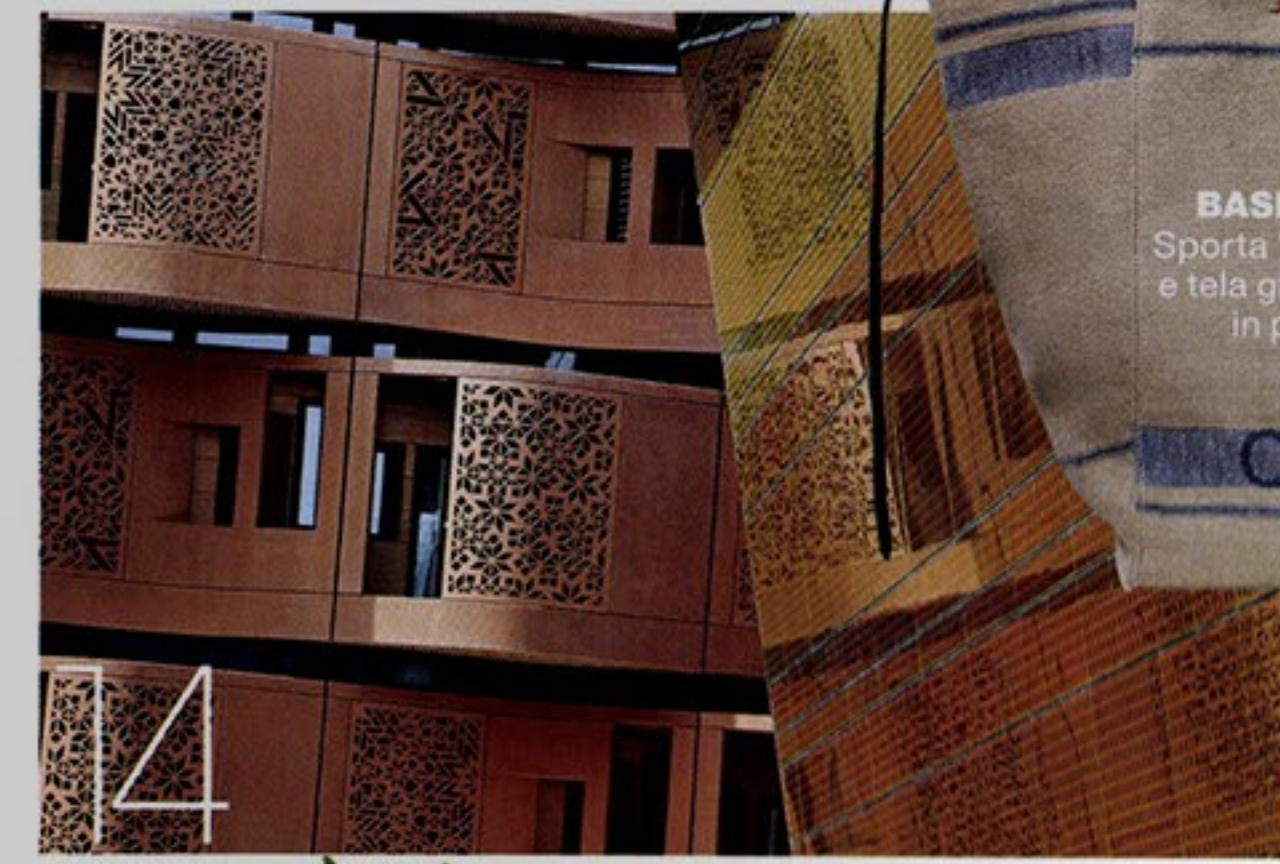
15 BASIC GLAMOUR Sporta "Phantom" in lino e tela grezza con manici in pelle, Céline.