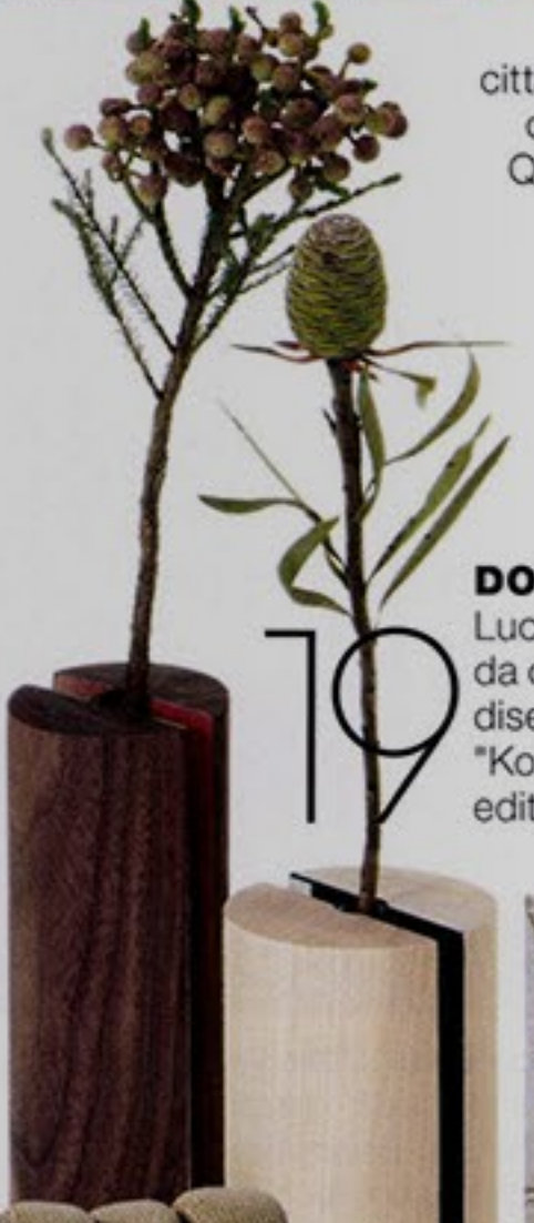
19 TEMPI NATURALI Pesa solo 40 grammi da cui è partito Piero Lissoni per disegnare il vaso-portacandele "Komorebi" di Porro, in limited edition, di noce o acero.